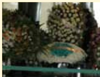
A última homenagem do CBO

“ Amigo de várias lideranças da especialidade em Minas Gerais, na condição de vice-presidente fez questão de prestigiar eventos realizados por entidades oftalmológicas