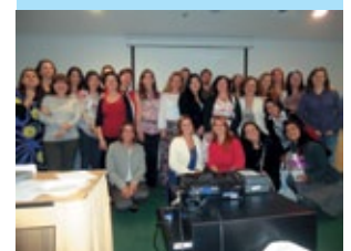
Final da Jornada

O CBOrt deseja um Excelente Natal e que 2012 reserve um bom ano profissional a todos os colegas ortoptistas, como também aos médicos oftalmologistas!