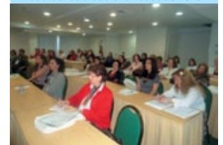
Participantes da Jornada