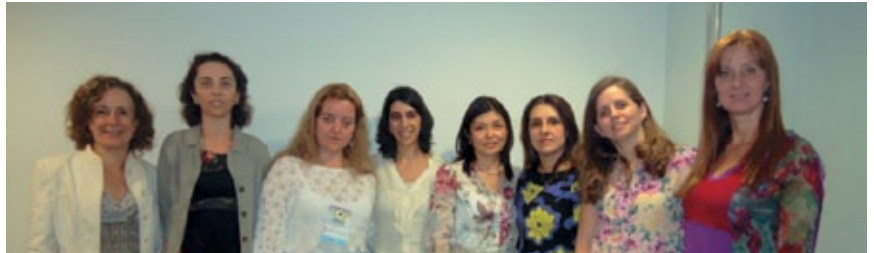
Diretoria eleita do CBOrt