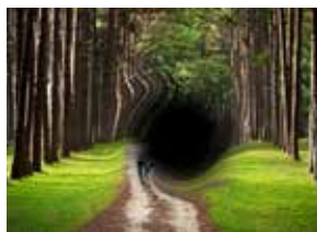
VISÃO COM DMRI